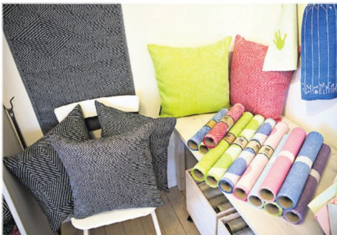
Tekstilmønstret på puderne hedder Gåsöga. Det er både enkelt og kompliceret med øjne, der følger dig. Det stiliserede mønster har været kendt siden jernalderen. Det bliver skåret tilfældigt på rullen, så ikke to puder er ens. Pris for en pude er 715,00 kr.