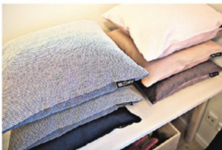
Pudeserien 'Demi', hvor de to sider forskellige væveteknikker - satinvævning og lærredsvævning - varierer tekstilets udtryk.

Butik med god service sælger naturlige miljøvenlige tekstiler med styrke og glans