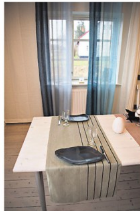
Trecolore gardiner designet af Lena Bergström. I forgrunden Gärdet løberen: Dinner for two. Design af Karl-Åke Johansson.

Der anvendes både klassiske og nye mønstre - fra væveriets start i 1920 og frem til i dag. Hørhusets mest solgte gardin er fra 1980 og hedder Manhattan, designet af Peter Condu. Det er, som de øvrige gardiner, vævet til kant, dvs. at det ikke skal sømmes i siden.