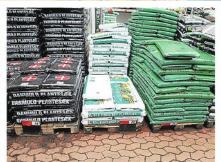
Hvad er der i sækken? side 6-7